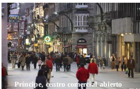
Príncipe, centro comercial abierto