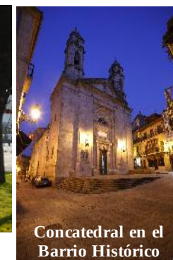
Concatedral en el Barrio Histórico