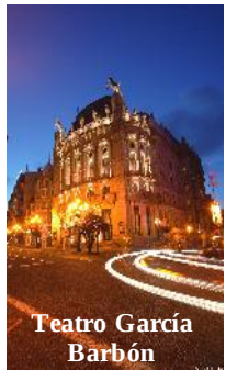
Teatro García Barbón