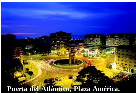
Puerta del Atlántico, Plaza América.

¿Dispones de al menos 3 días para descubrir Vigo? Te proponemos un itinerario para abrir la “Puerta del Atlántico” y sumergirte en una ciudad cosmopolita y emprendedora.