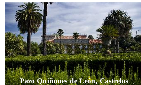
Pazo Quiñones de León, Castrelos