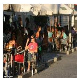
Terrazas en Montero Ríos