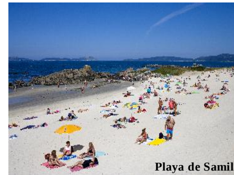
Playa de Samil

Deseamos que tu estancia en la ciudad deje huella en tu memoria.